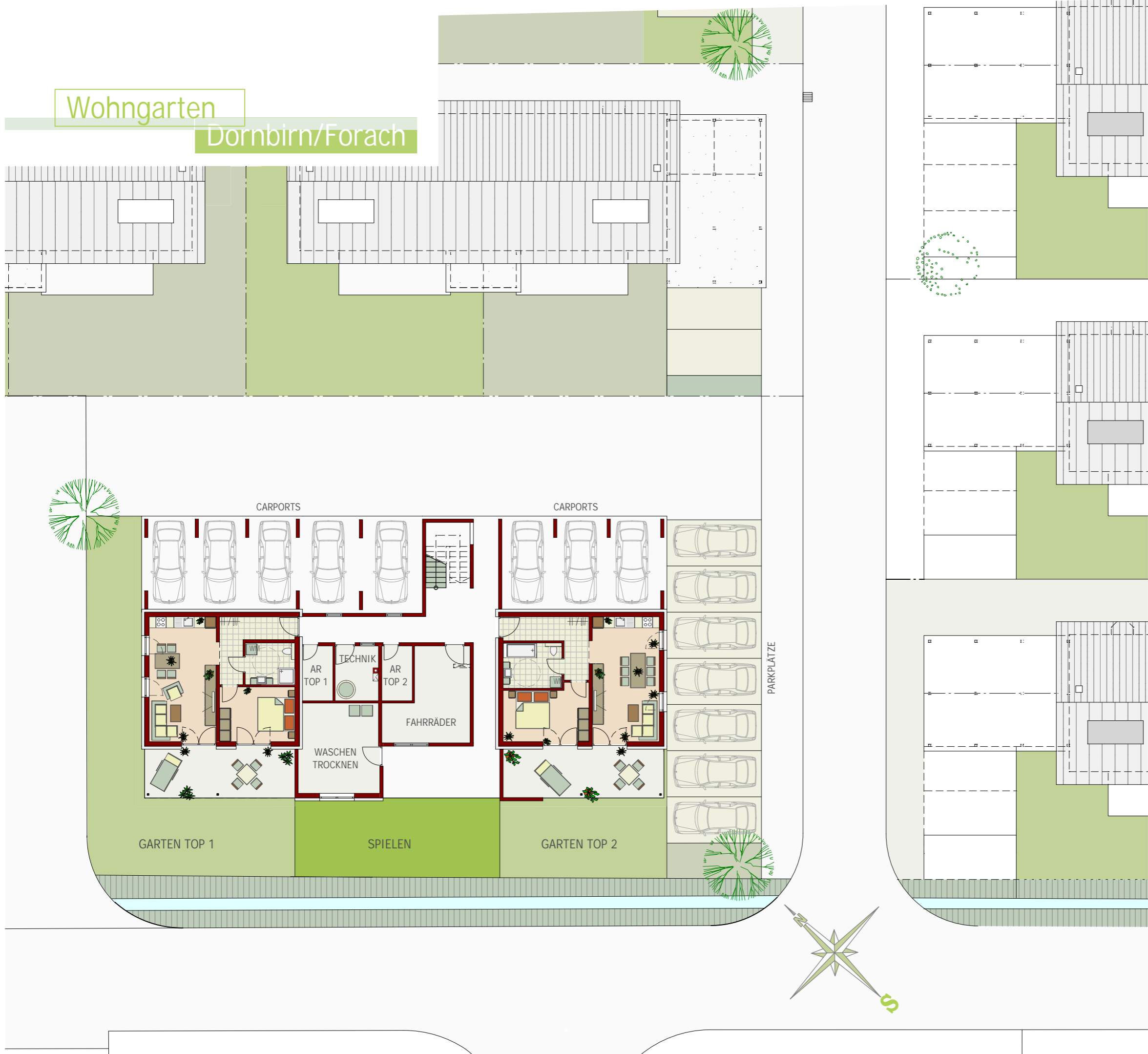
LAGEPLAN ERDGESCHOSS M 1:200